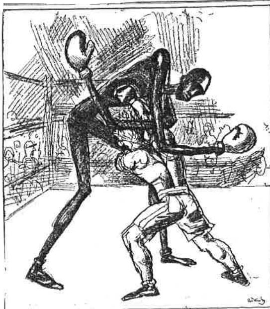
DÅGBLADET, LØRDAG 14. SEPTEMBER 1935.