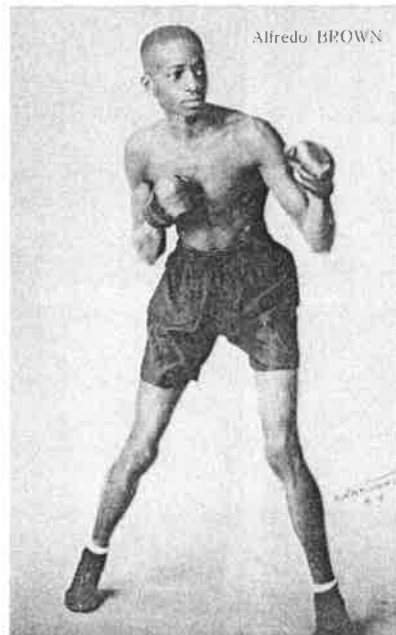
Figur 158: Europeiske postkort med bilder av bantammesteren Al Brown. Begge egen samling. Figur 161: Pete Sanstøl og Al Brown håndhilses i forkant av kampen på Bislett stadion, under en pressesamling på Ingierstrand Bad (under til venstre). Eier: Ric Kilmer, Sanstøls barnebarn (Shoreline, Washington). Figur 163: Brown satte sitt preg på den norske hovedstaden høsten 1935, også utenfor bokseringen. Her i en reklame fra norsk presse (under til høyre). Fra Sanstøls utklippssamling. Eier: Ric Kilmer.